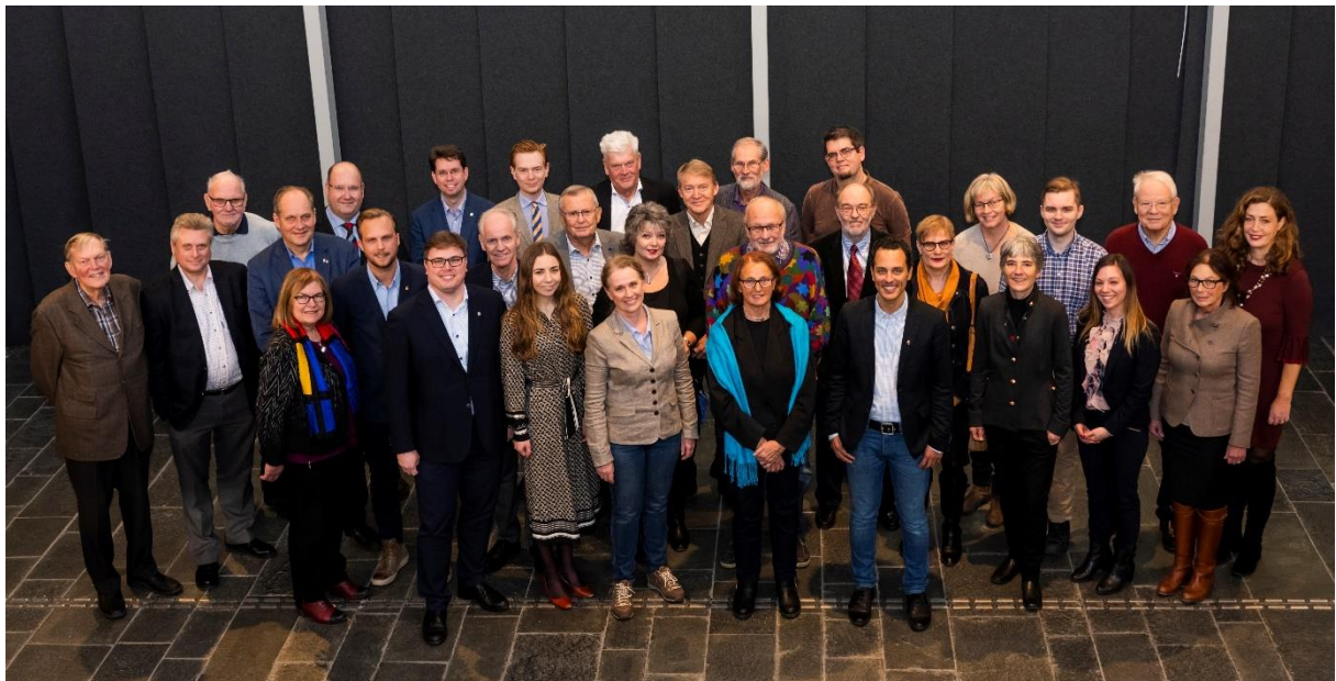
Lundakvintettens laguppställning när den presenterades i december 2018

5,75 miljoner kronor tillförs Utbildningsnämnden för att säkra den fortsatta goda utvecklingen av Lunds gymnasieverksamhet. Arbetet med förbättrad elevhälsa i enlighet med kommunfullmäktiges beslut i december år 2018 ska vidareutvecklas.